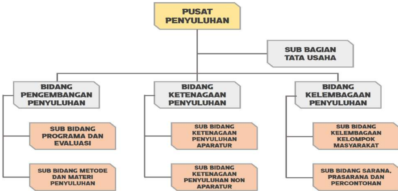
Gambar 1. Struktur Organisasi Pusat Penyuluhan

Pada periode Renstra Tahun 2015-2019, Pusat Penyuluhan memiliki sasaran strategis, yaitu meningkatnya kapasitas pelaku utama dan pelaku usaha dalam pemberdayaan masyarakat. Adapun yang dimaksud dengan pelaku utama yaitu masyarakat di dalam dan di sekitar kawasan hutan, petani, beserta keluarganya. Sedangkan pelaku usaha adalah perorangan warga negara Indonesia atau korporasi yang dibentuk menurut hukum Indonesia yang mengelola usaha kehutanan dan yang berkaitan dengan bidang kehutanan. Sasaran strategis tersebut diturunkan menjadi 4 sasaran indikator, yaitu :