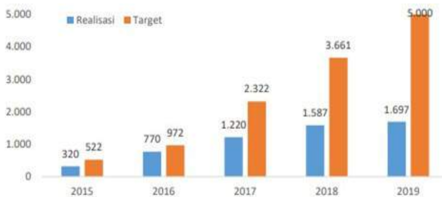
Gambar 2. Capaian IKK Peningkatan Kelas Kelompok Tani Hutan (KTH) dari Kelas Pemula Menjadi Kelas Madya Tahun 2015 s/d 2019

Sebanyak 1.697 unit KTH yang mendapatkan pendampingan dan fasilitasi peningkatan kelas memiliki jenis usaha dan komoditas yang beragam. Secara garis besar, terdapat 14 jenis komoditas, yang meliputi: madu, bambo, wisata alam, gaharu, mangrove, agroforestry, cuka kayu, aren, kopi, jamur tiram, minyak atsiri, konservasi flora dan fauna, ulat sutera dan kerajinan.