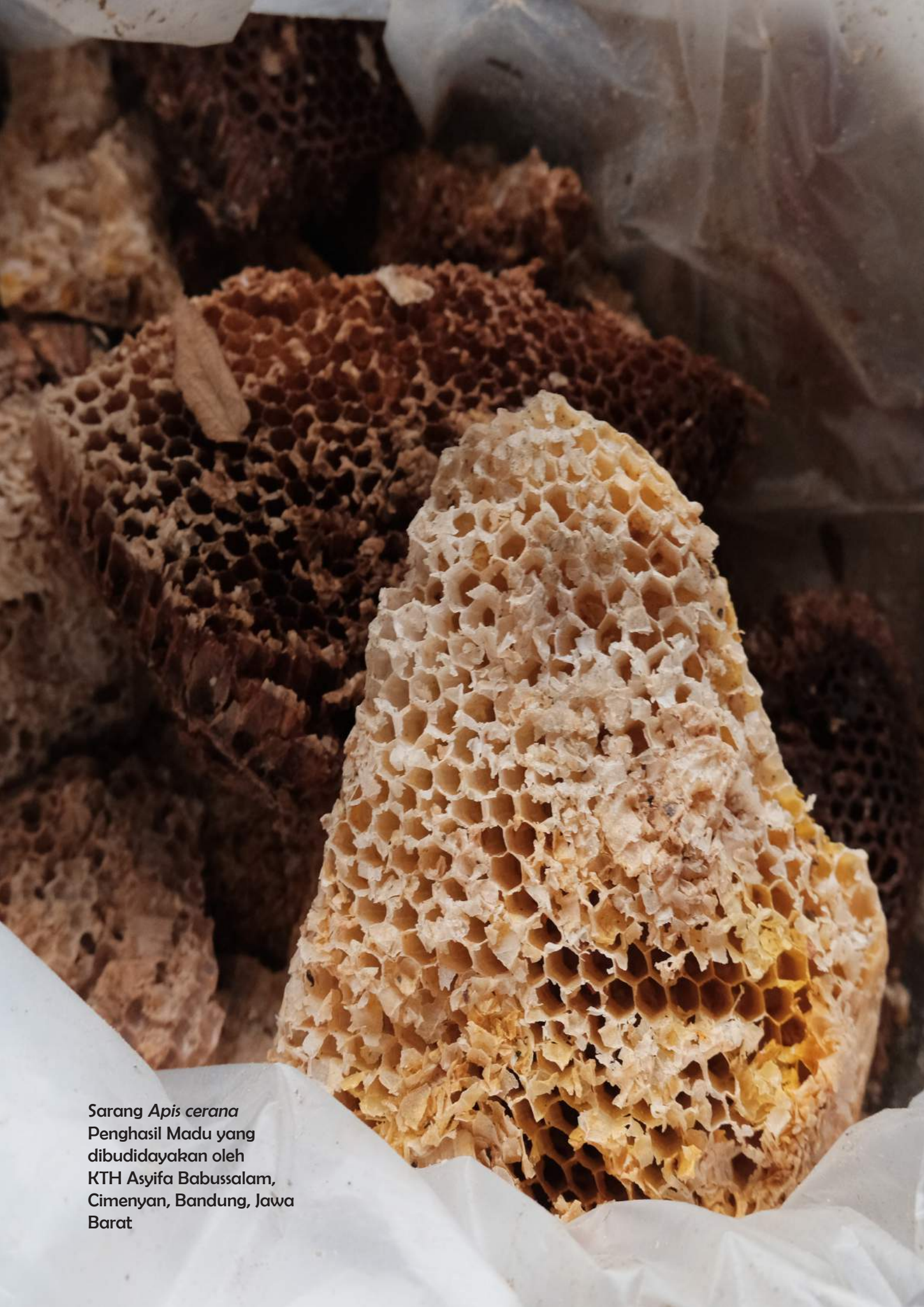
Sarang Apis cerana Penghasil Madu yang dibudidayakan oleh KTH Asyifa Babussalam, Cimendan, Bandung, Jawa Barat