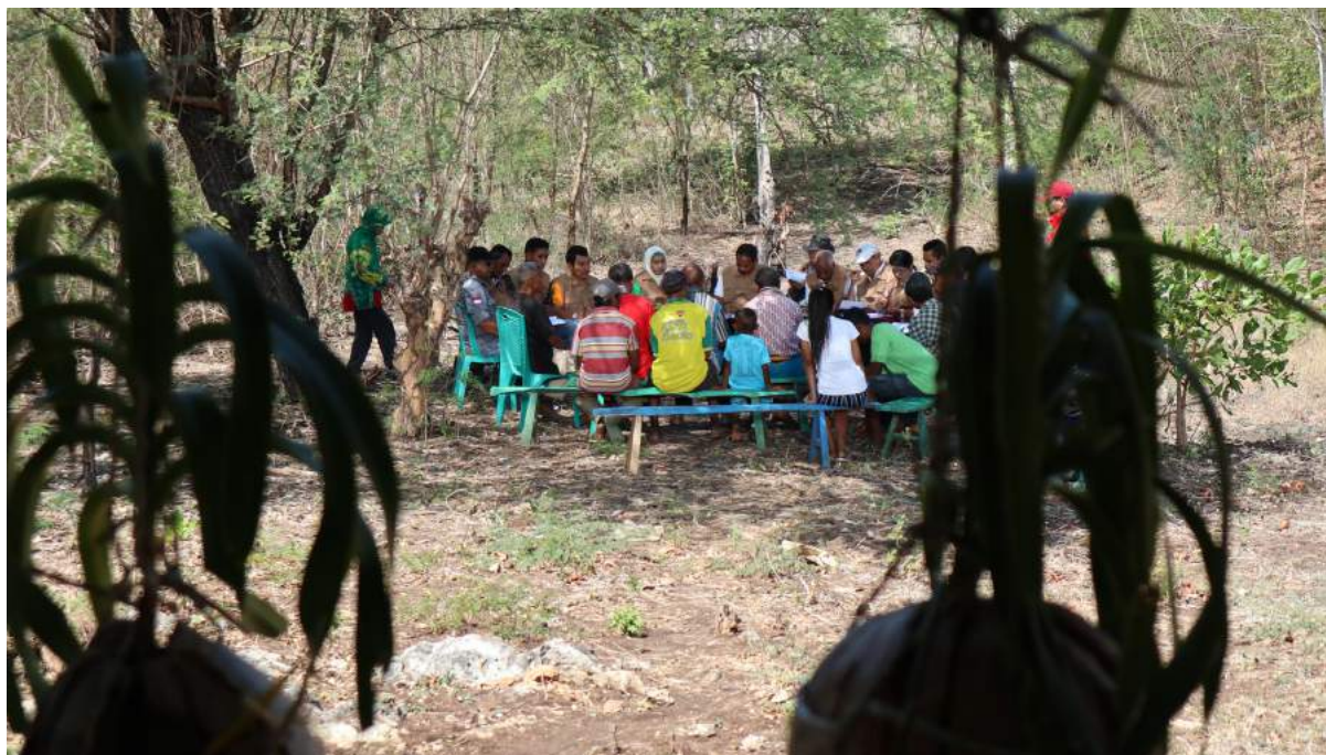
Kegiatan bimbingan teknis penyuluh kehutanan yang dilakukan oleh Pusat Penyuluhan