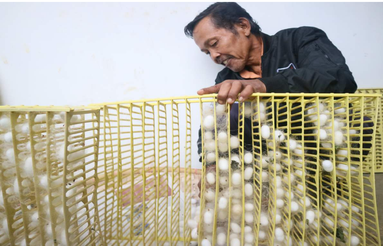
Salah seorang anggota KTH sedang menyeleksi Kokon yang selanjutnya akan diurai menjadi benang Sutera.

Kegiatan fasilitasi pembentukan Koperasi KTH telah berdampak terhadap meningkatnya pendapatan anggota KTH, meluasnya cakupan wilayah pemasaran hasil usaha KTH yaitu 67% lokal, 27% nasional dan 5% luar negeri, terbukanya akses modal bagi KTH.