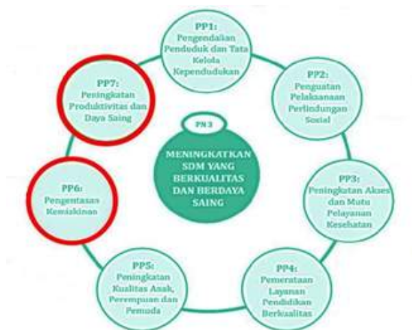
Gambar 7. Dukungan BP2SDM pada Prioritas Nasional 3

Agenda Pembangunan/ PN-3 memuat 7 Prioritas Program diijelaskan sebagaimana Gambar 7.