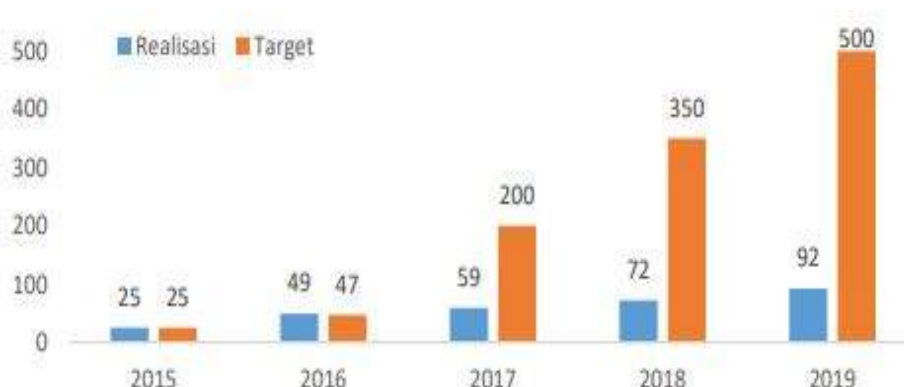
Gambar 3. Capaian IKK Pembentukan Koperasi Kelas Kelompok Tani Hutan (KTH) Tahun 2015 s/d 2019

Koperasi KTH dibentuk dengan tujuan meningkatkan kesejahteraan anggota KTH. Status badan hukum koperasi menjadi syarat yang akan memudahkan KTH dalam memperoleh akses permodalan. Selain itu, dengan adanya badan hukum koperasi, KTH dapat dengan mudah menjalin kerjasama kemitraan dengan pelaku usaha lainnya.