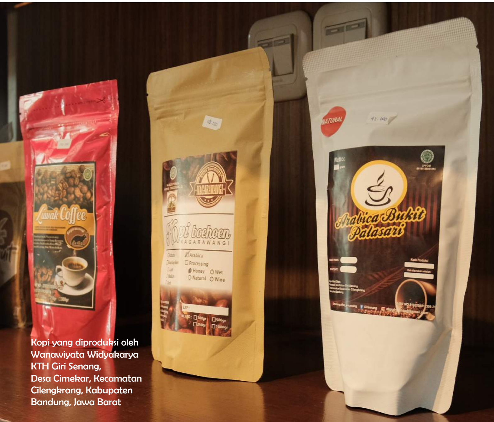
Kopi yang diproduksi oleh Wanawiyata Widyakarya KTH Giri Senang, Desa Cimekar, Kecamatan Cilengkrang, Kabupaten Bandung, Jawa Barat