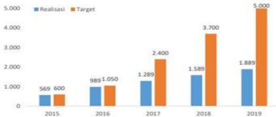
Gambar 5. Capaian IKK Tenaga Pendamping Handal bagi KTH dalam Pemberdayaan Masyarakat di desa-desa hutan Tahun 2015 s/d 2019

Selama tahun 2015 s/d 2019, Pusat Penyuluhan telah melaksanakan peningkatan kapasitas penyuluh kehutanan sebanyak 2.108 orang. Dalam rangka mendukung percepatan program nasional perhutanan sosial, kegiatan peningkatan kapasitas penyuluh kehutanan yang dilaksanakan fokus pada peran penyuluh dalam pendampingan masyarakat/kelompok Pemegang Izin. Hal ini dilakukan karena pemberian akses pemanfaatan kawasan hutan sosial kepada masyarakat tidak terbatas pada diterbitkannya ijin, akan tetapi mewujudkan kemandirian kelompok dalam mengelola kawasan itu sendiri menjadi langkah selanjutnya yang tidak dapat ditinggalkan. Dalam hal ini, tenaga pendamping baik Penyuluh Kehutanan, Lembaga Swadaya Masyarakat, dan Penyuluh Kehutanan Swadaya Masyarakat mengemban tugas yang sangat penting dalam mendorong kesuksesan implementasi perhutanan sosial ditingkat tapak.