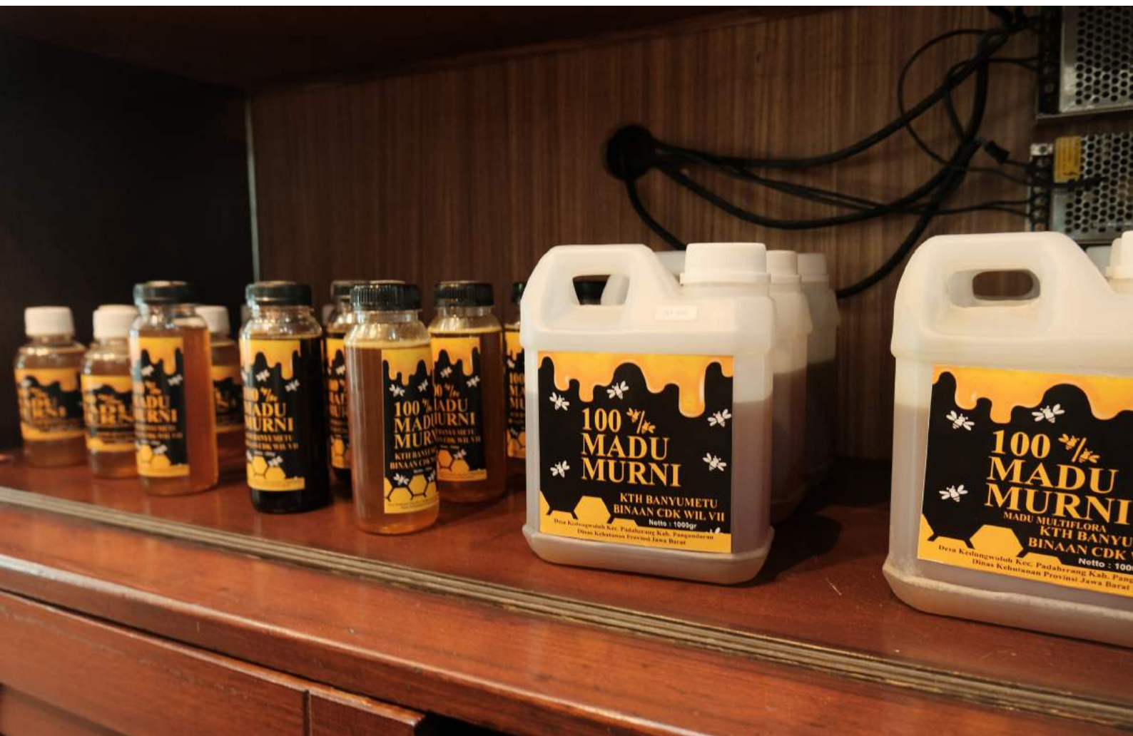
Madu yang diproduksi oleh KTH Banyumetu Binaan CDK Wilayah VII, Kecamatan Pangandaran, Kabupaten Pangandaran, Provinsi Jawa Barat

Pada Tahun 2019, jumlah KTH yang meningkat kelasnya dari pemula ke madya sebanyak 1.697 unit yang tersebar di seluruh Indonesia. Kelompok Tani Hutan kelas pemula memiliki karakteristik kelembagaan yang belum kuat dan adanya usaha yang baru dibentuk. Sehingga peningkatan kelas KTH dari pemula menjadi madya merupakan upaya agar KTH yang telah dibentuk menjadi lebih kokoh dalam kelembagaan, pengelolaan kawasan/ wilayah dan pengembangan usaha yang dilakukan. Dampak dari kegiatan peningkatan kelas KTH yaitu KTH menjadi kelompok yang lebih berdaya saing dengan adanya kelembagaan yang lebih kuat. Selain itu juga, adanya peningkatan pendapatan bagi petani melalui pengembangan usaha yang lebih maju. Adapun kelestarian hutan dan SDA serta keberlanjutan usaha KTH menjadi dampak dari pengelolaan kawasan/ wilayah yang tepat dan sesuai dengan asas kelestarian.