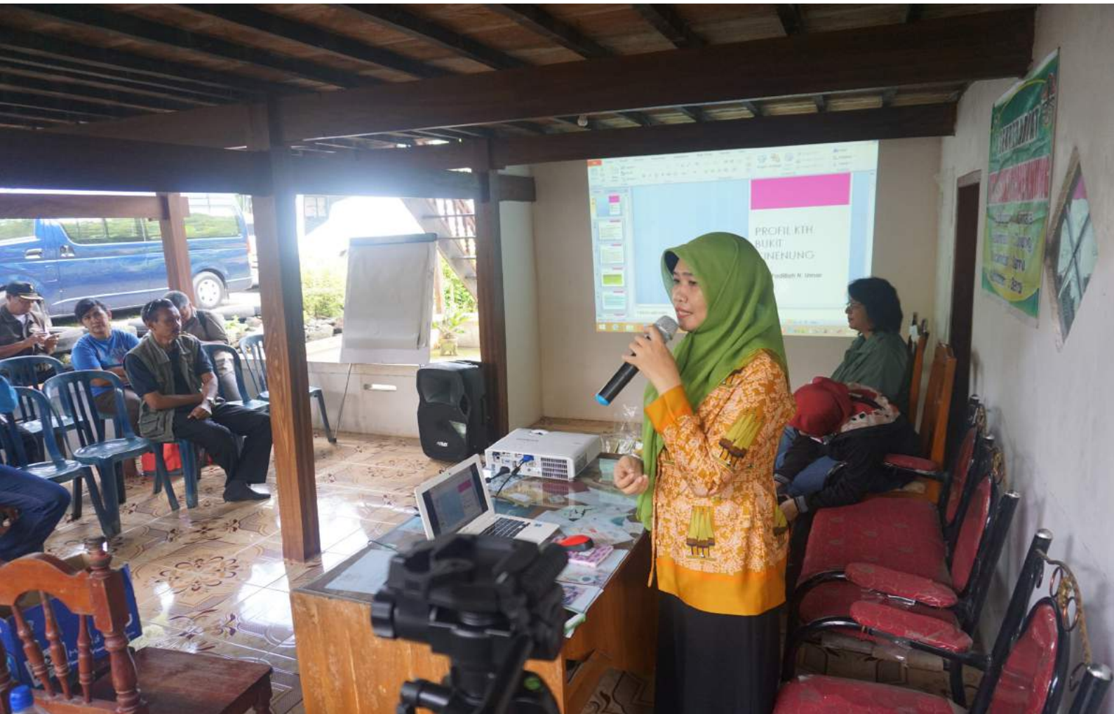
Kegiatan fasilitasi pembentukan koperasi KTH yang dilakukan oleh Pusat Penyuluhan

Badan P2SDM mendukung sasaran strategis 4 Kementerian LHK yaitu “Tercapainya Produktivitas dan Daya Saing SDM Kementerian LHK serta Efektivitas Tata Kelola Pembangunan Lingkungan Hidup dan Kehutanan Yang Baik (SS-4)”. Indikator utama yang didukung oleh Badan P2SDM yaitu (1) Kategori Efektivitas Pengelolaan Kawasan Hutan; (2) Nilai Kinerja Reformasi Birokrasi Kementerian LHK; dan (3) Indeks Produktivitas dan Daya Saing SDM Kementerian LHK. Untuk mendukung indikator utama tersebut, Badan P2SDM memiliki 6 (enam) indikator kinerja program dengan 18 (delapan belas) indikator kinerja kegiatan.