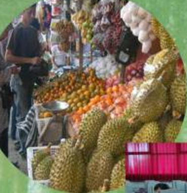
Ekonomi yang maju