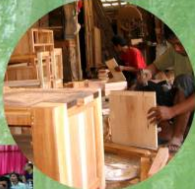
Industri yang berkembang