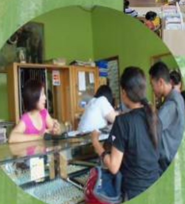
Kesejahteraan yang meningkat