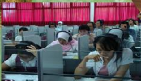
Pendidikan dan Sosial lebih baik