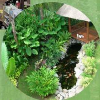
Lingkungan yang asri dan seimbang