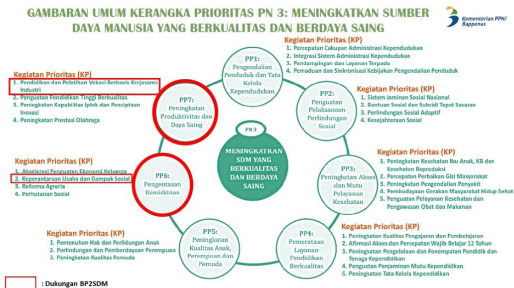
Gambar 3. Dukungan Pusat Penyuluhan pada Prioritas Nasional 3

Kegiatan Pusat Penyuluhan dalam kerangka pembangunan nasional termasuk ke dalam Prioritas Nasional Meningkatkan Sumber Daya Manusia Berkualitas dan Berdaya Saing, Program Prioritas Pengentasan Kemiskinan, Kegiatan Prioritas Keperantaraan Usaha dan Dampak Sosial, Proyek Prioritas Penyuluhan dan/atau Pendampingan bagi kelompok masyarakat lingkungan hidup dan kehutanan.