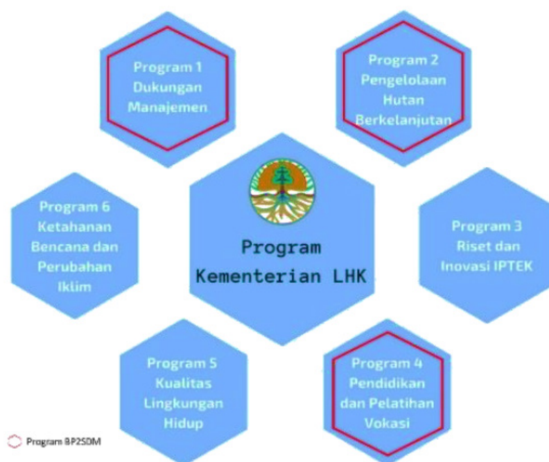
Gambar 4. Program Badan P2SDM Tahun 2021