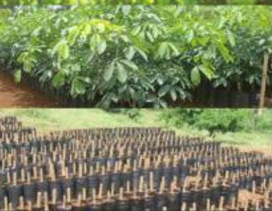
“Kebun Bibit Desa” (KBD)