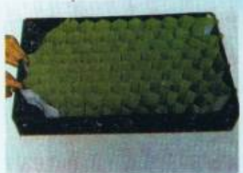
Benih yang telah tumbuh tunas