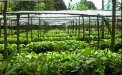
“Kebun Bibit Permanen” (KBP)