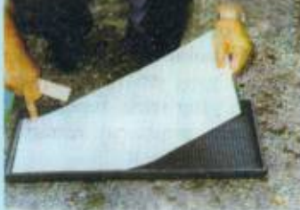
Pembuatan media tanam