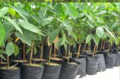
“Kebun Bibit Sekolah” (KBS)