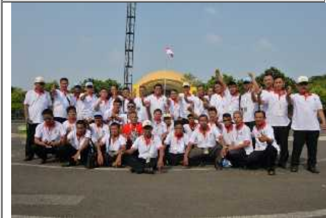
Rangkaian Acara Temukarya Pemenang Lomba Wana Lestari Tahun 2015