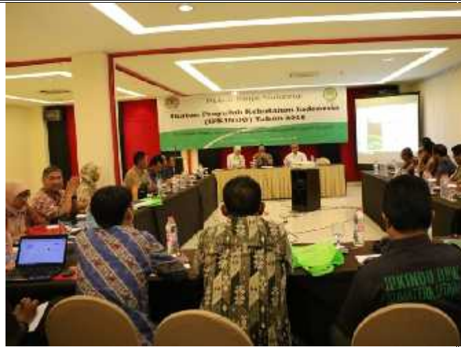
Rapat Kerja IPKINDO Tahun 2015 dengan Pusat Penyuluhan