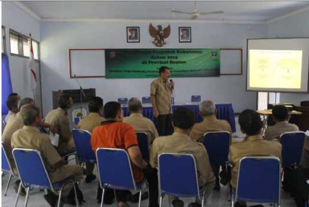
Rangkaian Acara Pembinaan Penyuluh Kehutanan PNS 2015 di beberapa Provinsi