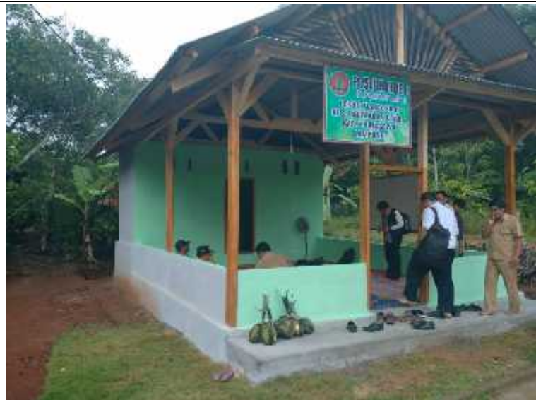
POSLUHUTDES Kab. Pringsewu