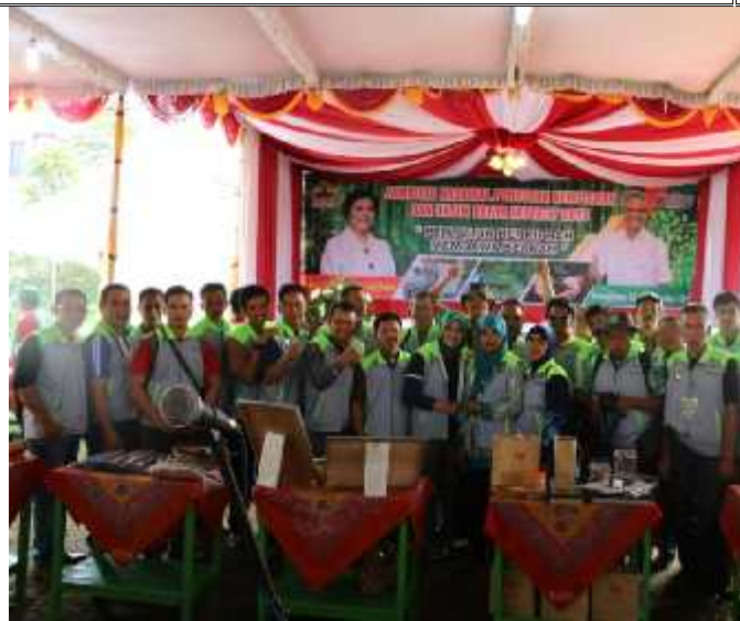
Munas PKSM Tahun 2015 di Karang Anyar