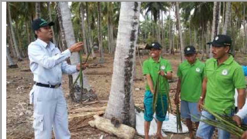
Kegiatan LP2UKS Wanawiyata Widyakarya