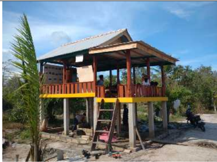
POSLUHUTDES KTH Gempa 01 Kab. Bangka Tengah